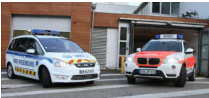
Véhicules d'aide médicale urgente français et allemand

* Le CESER appelle à pérenniser la coopération qui a eu lieu entre les hôpitaux frontaliers franco-allemands ou franco-luxembourgeois lors du pic de la crise sanitaire ( Les 100 propositions du CESER Grand Est « pour une refondation économique, sociale et environnementale » - 2021 - Proposition N°71 ).