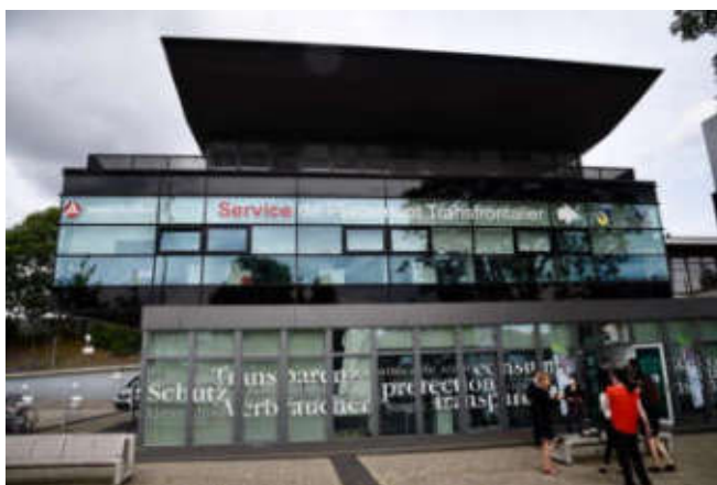
Bâtiment du service de placement transfrontalier à Kehl

Si la dématérialisation offre de nouveaux moyens d'accès aux services publics pour une majorité d'utilisateurs, elle comporte aussi un risque de recul de l'accès aux droits et d'exclusion pour nombre de citoyens, en difficulté avec les usages numériques. Ce risque est encore accru pour les habitants des zones transfrontalières, qui relèvent de régimes spécifiques d'imposition ou de couverture sociale.