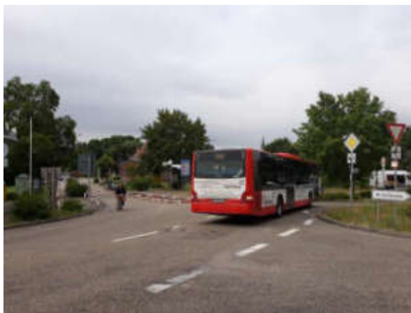
Bus transfrontalier sur la ligne Kandel-Lauterbourg-Berg

* Le CESER appelle la Région Grand Est à peser de tout son poids pour faire avancer le projet de rétablissement de la ligne ferroviaire entre Colmar et Fribourg , ainsi que pour accélérer la réactivation de la ligne Rastatt-Haguenau obligatoire dans le cadre du Traité d'Aix-la-Chapelle. Ces deux projets doivent être inscrits sur la carte des réseaux transeuropéens de transport (RTE-T) de la Commission européenne, à l'instar de la ligne Givet-Dinant.