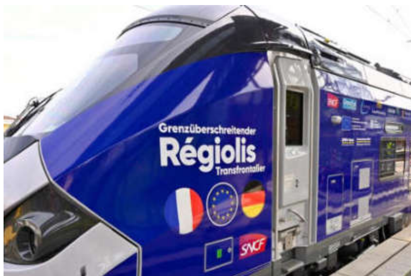
Train transfrontalier Regionalis

Toutefois, les textes législatifs de ces dernières années, en particulier les lois MAPTAM (2014) et NOTRe (2015) ont plutôt privilégié la notion de territoire « pertinent ». Dans un rapport de janvier 2015 préalable à l'adoption de la loi NOTRe, le Commissariat général à l'égalité des territoires (CGET)* a relevé l'inadéquation de la notion de bassin de vie comme assise territoriale des intercommunalités. En effet, en s'appuyant uniquement sur l'existence d'équipements accessibles dans un certain rayon,