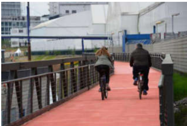
Voie verte trinationale Bâle-Huningue-Weil am Rhein

Selon le Conseil fédéral en 2004, il faut entendre par service public « une offre de services de base de qualité, comprenant des biens et des prestations d'infrastructure, accessibles à toutes les catégories de la population et offerts dans toutes les régions du pays à des prix abordables et aux mêmes conditions ».