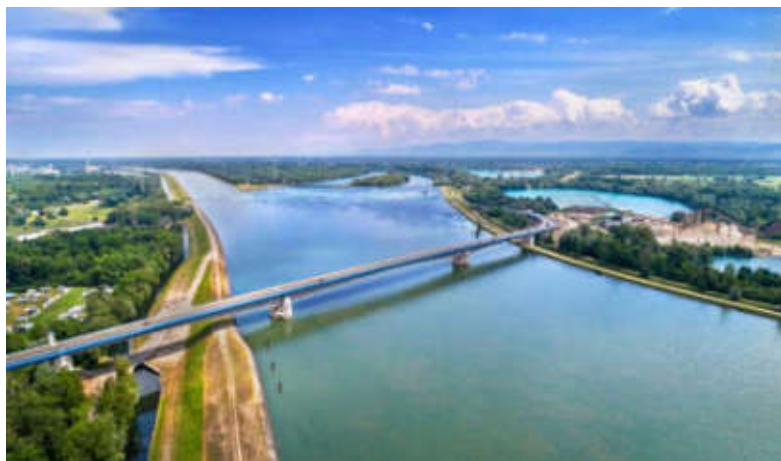
Pont Pierre Pflimlin entre France et Allemagne

Stricto sensu, la notion de service public est absente de la terminologie juridique allemande. Pour autant, il y a bien en Allemagne des activités répondant à un objectif d'intérêt général. On les retrouve sous l'appellation « Daseinsvorsorge », apparue dans les années 1930. Intraduisible en français, cette notion recouvre tout ce qui est nécessaire pour pourvoir aux besoins d'existence d'un individu et peut s'étendre à tout ce qu'il faut pour mener une vie moderne décente en société. La dimension évolutive des besoins est donc dès l'origine incluse dans cette notion, qui se développera avec « l'Etat social » de la nouvelle constitution allemande de 1949.